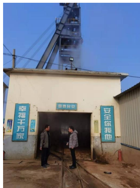
图 9-1 现场调查照片